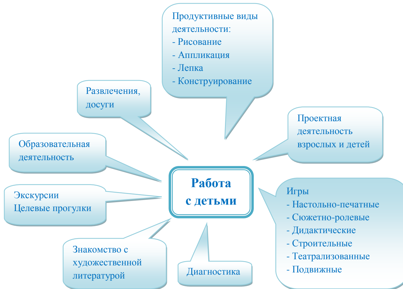
Рис.1 Формы работы с детьми по обучению безопасному поведению на дороге